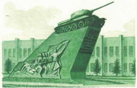
г. Орджоникидзе. Монумент защитникам города. 1942 год.